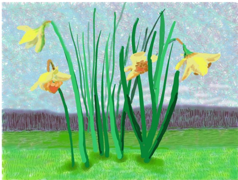
David Hockney, Do remember they can't cancel the spring, 2020

Rovnako i vy premýšľajte nad názvom svojho diela a jeho významom a odkazom.