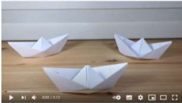
#ORIGAMI #PAPERFLEXIA COMO HACER UN BARQUITO DE PAPEL