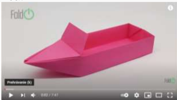
How to Make a Paper Boat that Floats | Paper Speed Boat | Origami Boat