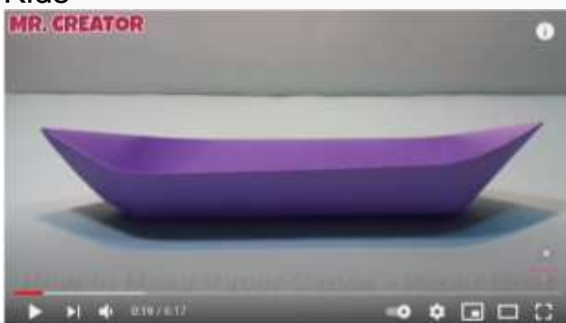
How to Make a Paper Canoe - Paper Boat Making Origami Tutorial for Kids