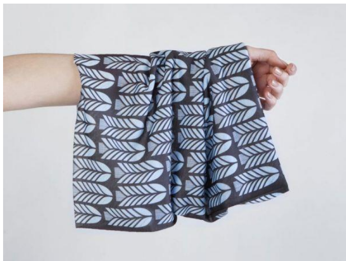
autorský dizajn slovenská značka Poujd