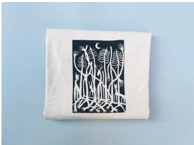
autorský dizajn Alesia Lumni